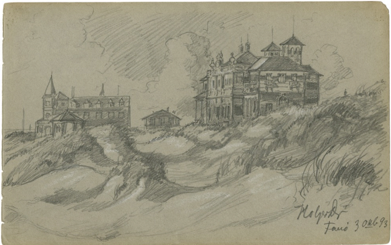
I 1893 besøgte Holger Drachmann for fjerde gang Fanø. Her har han tegnet Kurhotellet og det nyopførte Strandhotellet med musikpavillonen liggende foran. Mellem de to hoteller ses varmbadehuset. Original i Fanø Kunstmuseum.