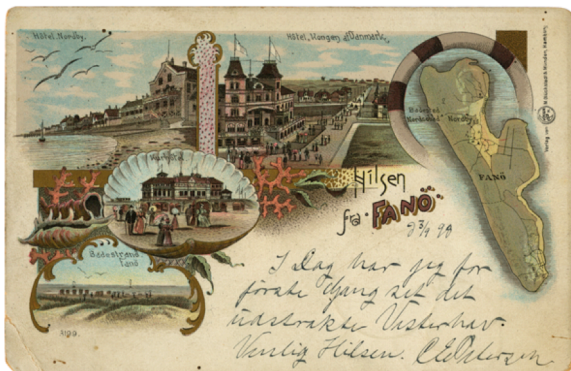
Et rigtigt souvenirpostkort fra Fanø Bad. Romantisk og indbydende ser det unægtelig ud med alle sommerlivets glæder og fristelser: Hotel Nordby, Kurhotellet og Hotel Kongen af Danmark med promenerende sommergæster med parasoller og stranden med badevogne. Alt pynteligt indrammet med muslingeskaller og eksotiske koraller.

Året efter opførtes Strandhotellet og i pinsen 1894 kunne det luksuriøse "Hotel Kongen af Danmark" indvies med endnu en storslået fest med fornemme gæster som i 1892, denne gang endda med selveste Georg Brandes. Men mon ikke det er sandsynligt, at Weisz & Co fortrød invitationen af Brandes, da de i Politiken nogle dage efter indvielsen blandt andet kunne læse disse ord om "badeforetagendets" arkitektur: "Hotel Kongen af Danmark minder kun alt for levende om en eller anden tårnbygning på Nørrebro - og rundt om er der små villaer af røde mursten. Alle disse bygninger står ved deres hele stil i en beklagelig strid med den omgivende natur. De er bygget af tyske arkitekter, som disse ville bygge i Berlin eller uden for Berlin, men uden noget hensyn til overensstemmelse med naturen her". Næsten en profetisk opfattelse af en senere tids vurdering af datidens historicistiske arkitektur!