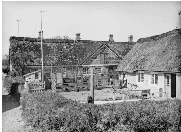
Forsbergs Hus, Landevejen 7 i Sønderho.