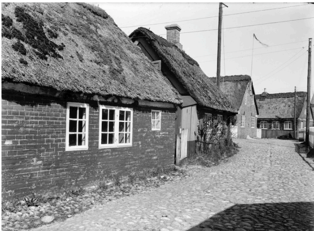
Hjørnet af Kikkebjergvej 3 og Mellemgaden 11.

Det blev til 56 motiver fordelt ligeligt mellem Nordby og Sønderho. I Nordby valgte Hugo Matthiessen at stille kameraet op flere steder fra Hovedgaden i nord og i Mellemgaden, på Barkvej, Brigvej, Færggårdsvej, Niels Engersvej, Skolevej, Th. Schmidts Vej og Møllesti i syd foruden mange flere. I Sønderho blev han naturligt nok tiltrukket af det velbevarede Øster Land, men også af husene omkring Kropladsen, Nord Land, Sønder Land, Toftestien og Landevejen havde hans interesse. Interessant nok stiftedes Fonden Gamle Sønderho tilfældigvis(?) to måneder senere!